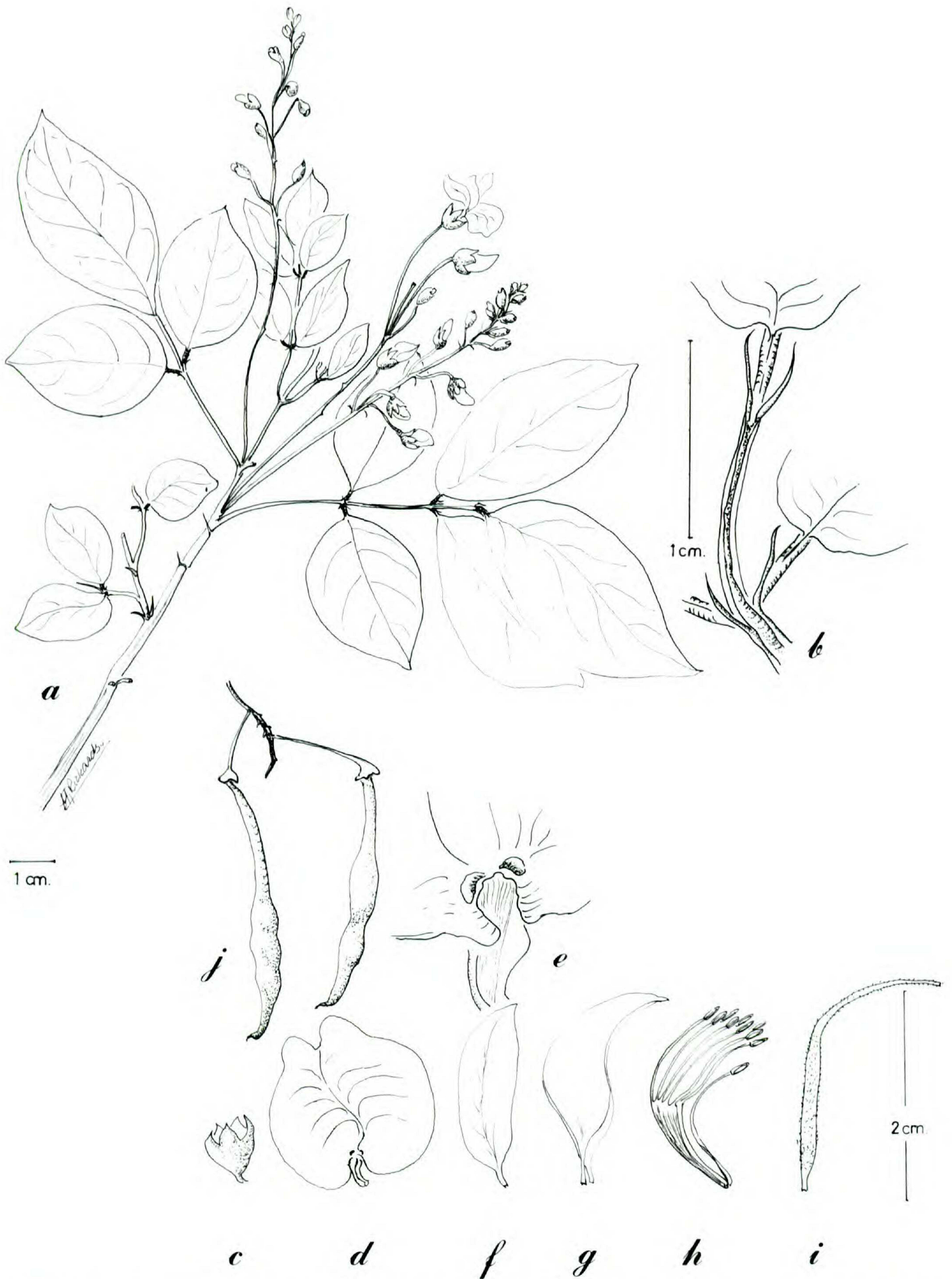
FIGURE 7. Coursetia paucifoliolata .—a. Rama florífera.—b. Apice del raquis, mostrando estipelas y pulvínulos.—c. Cáliz.—d. Estandarte.—e. Base de la lámina del estandarte, mostrando las callosidades.—f. Ala.—g. Quilla.—h. Androceo.—i. Gineceo.—j. Infrutescencia. Las hojas, inflorescencias y flores de Stevens 15813 , la infrutescencia de Stevens 16055 .